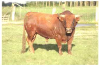
Nº 32 DE RAMILLO. ENCASTE CARRIQUIRI 492 kg. (Utrero)