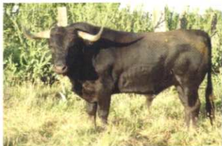
Nº 9 DE VIUDA DE CALZADO. ENCASTE BALTASAR IVÁN 536 kg. (Toro 4 años)