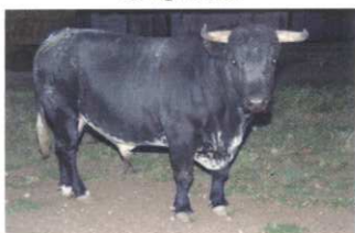
Nº 17 DE VEGA VILLAR. ENCASTE PROPIO 605 kg. (utrero)