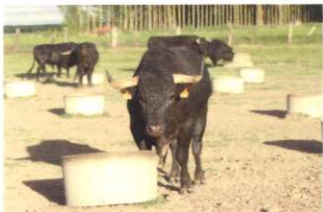
Nº 5 DE MERINO GARDEN. ENCASTE STA. COLOMA 523 kg. (Toro 5 años)