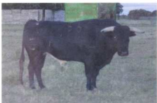
Nº 56 DE HACHAS. ENCASTE NÚÑEZ 525 kg. (utrero)