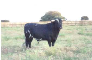
Nº 13 DE CHAFI. ENCASTE CRUCE MEJICANO 492 kg. (utrero)