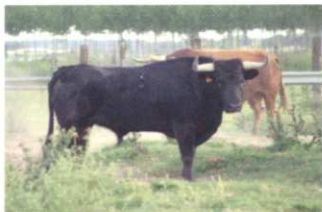
Nº 53 DE CUARTERO. ENCASTE ATANASIO 475 kg. (toro 4 años)