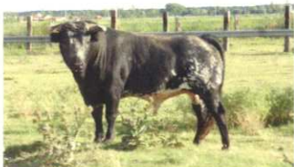
Nº 5 DE M o JESÚS BARRAL. ENCASTE COQUILLA 505 kg. (toro 4 años)