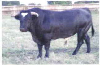
Nº 21 DE SAN MARTÍN. ENCASTE SAN MARTÍN 526 kg. (Toro 4 años)