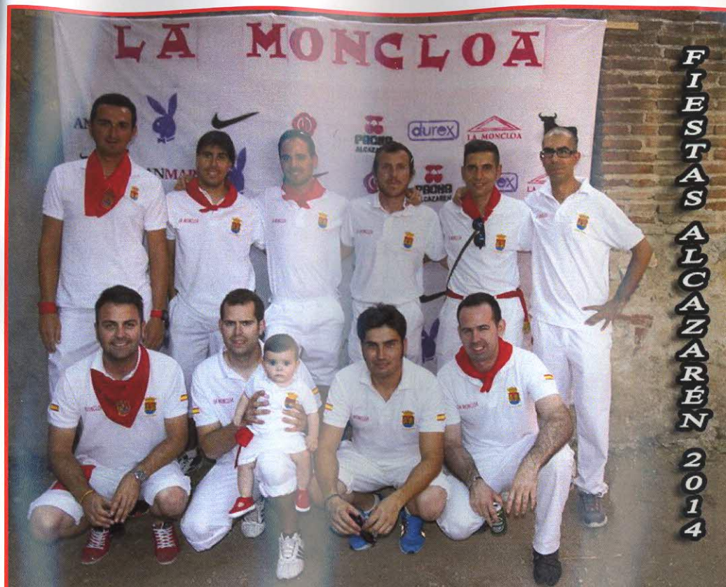
Peña "La Moncloa", ganadores 2014.

Queda prohibido maltratar al ganado con cualquier tipo de objeto.