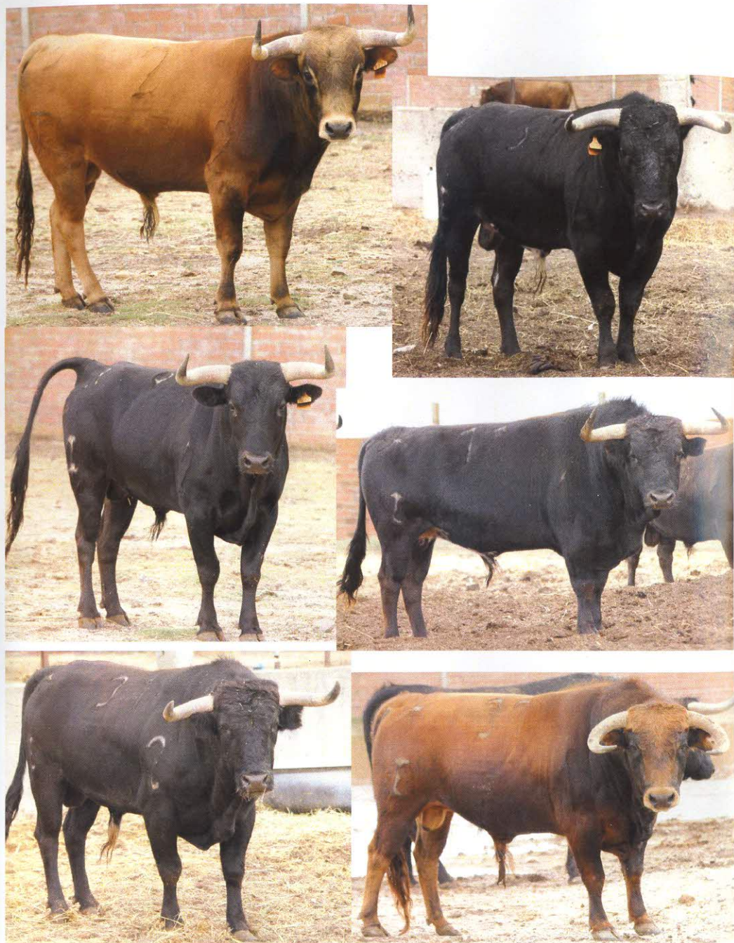
TOROS PARA LOS ENCIERROS FIESTAS SANTIAGO APOSTOL 2015